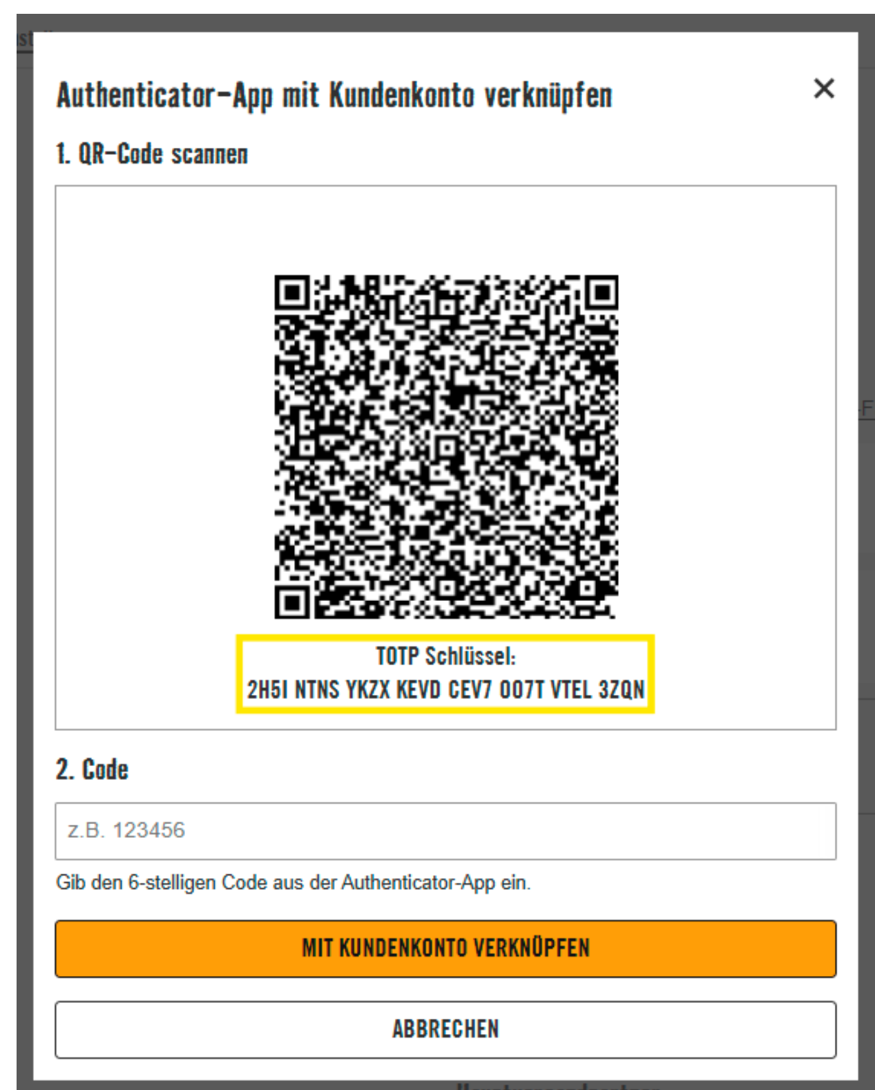
(2) Neues Fenster mit QR-Code