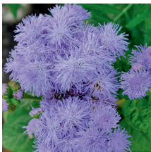
Agérate du Mexique