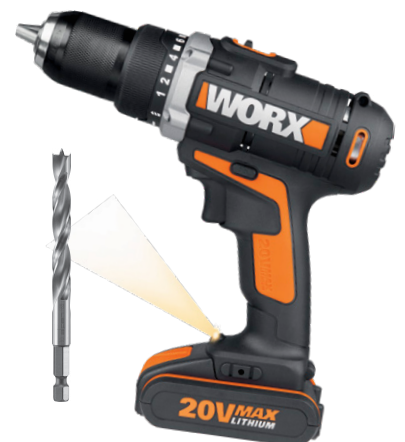
Perceuse-visseuse sans fil avec foret à spirale à bois Ø 4 mm