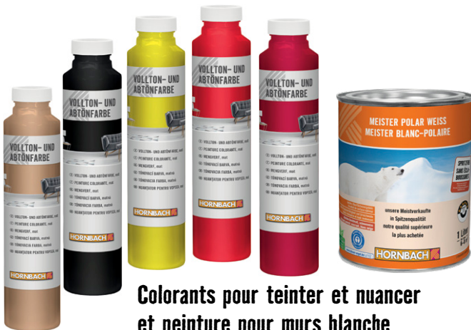
Colorants pour teinter et nuancer et peinture pour murs blanche