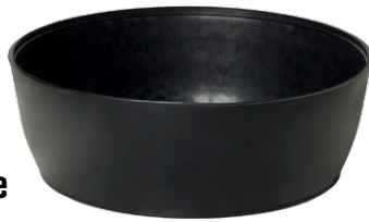
Bol pour plâtre