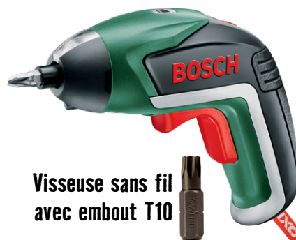
Visseuse sans fil avec embout T10