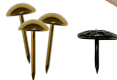
Clous d'ameublement et clous décoratifs