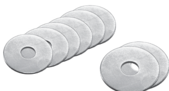
Rondelles à garde-boue 5,3 x 20 mm 5,3 x 25 mm