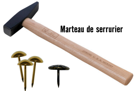
Marteau de serrurier