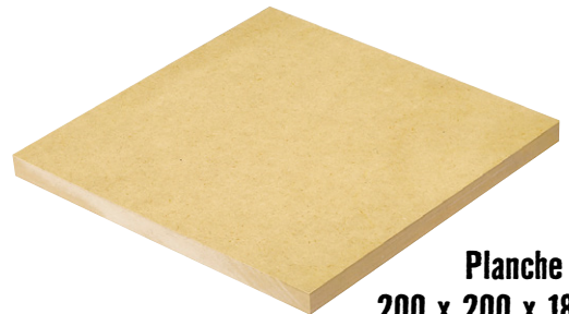
Planche MDF 200 x 200 x 18 mm