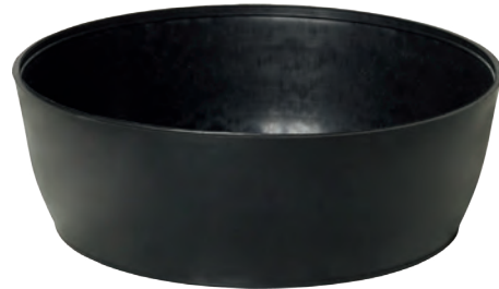
Bol à plâtre