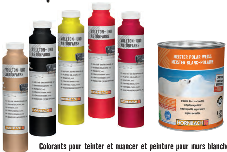
Colorants pour teinter et nuancer et peinture pour murs blanche