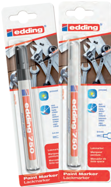
Marqueurs peinture noir et blanc