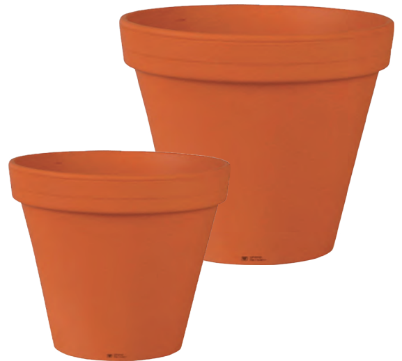
Pots en terre cuite 11 cm / 15 cm