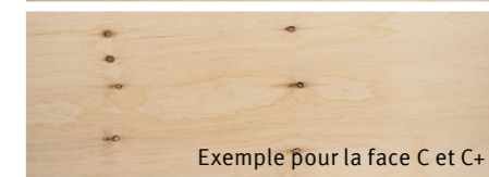
Exemple pour la face C et C+