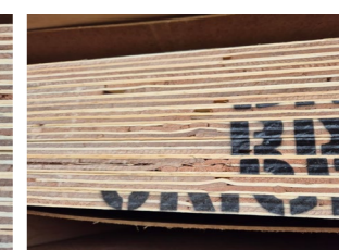
Placage avec chevauchement