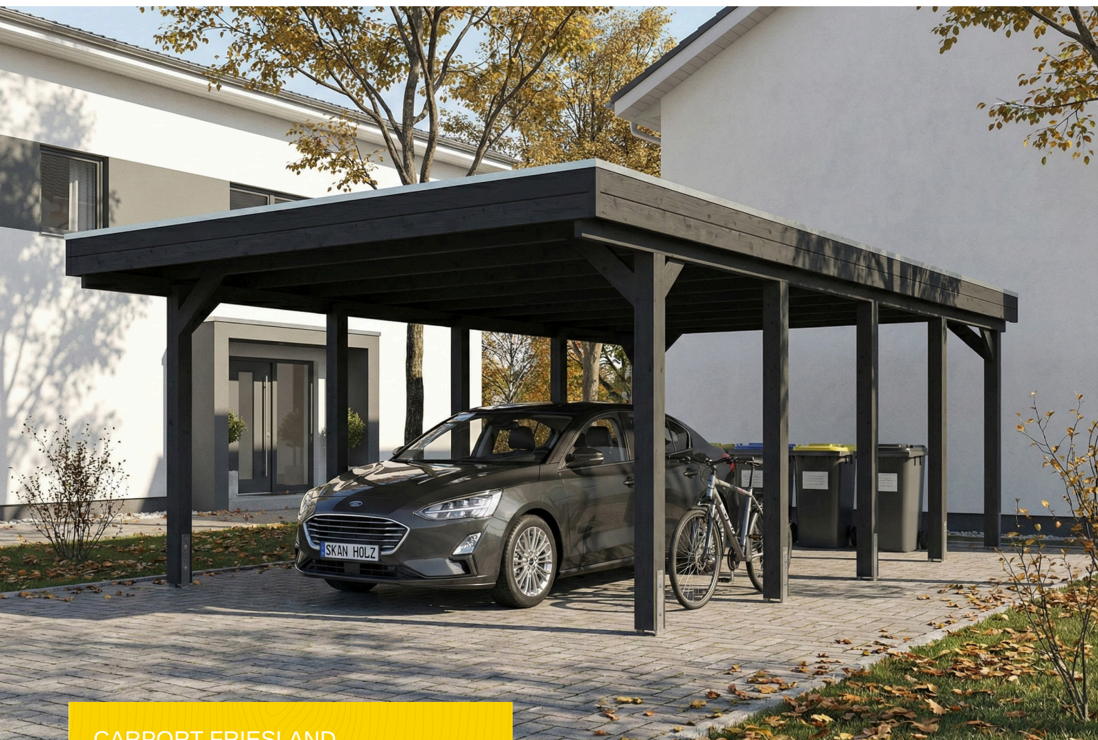
CARPORT FRIESLAND 402 x 708 cm