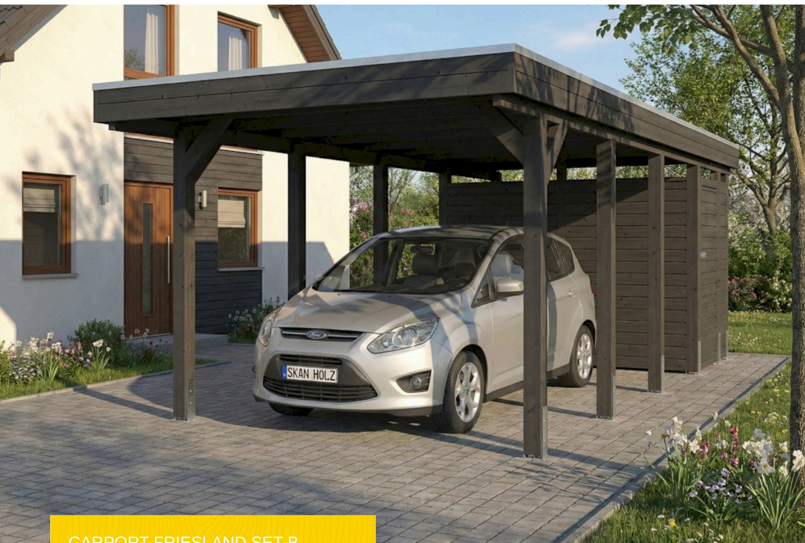
CARPORT FRIESLAND SET B 320 x 708 cm