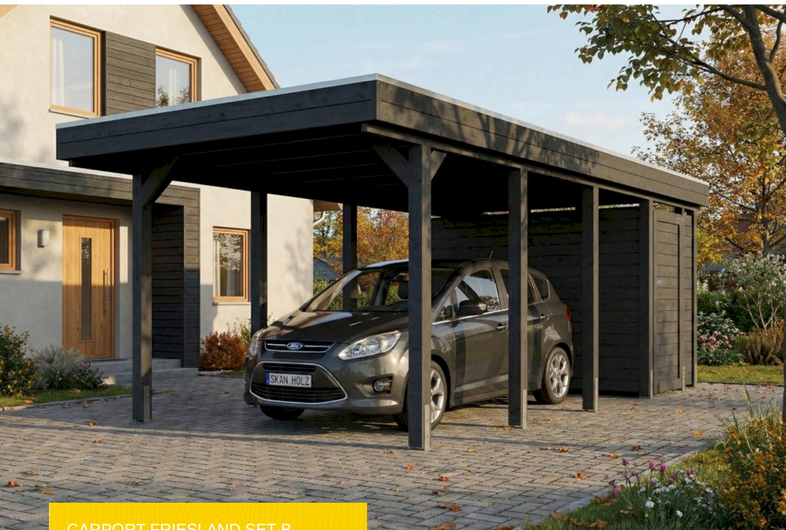
CARPORT FRIESLAND SET B 320 x 708 cm