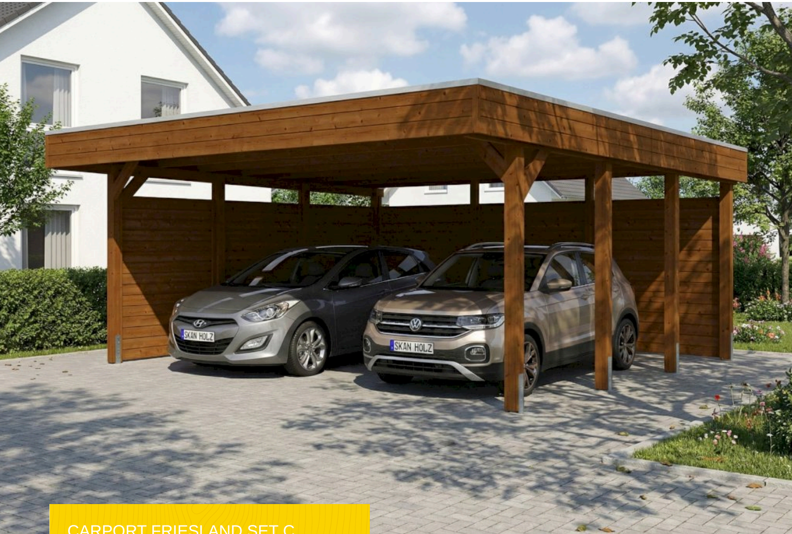
CARPORT FRIESLAND SET C 546 x 555 cm