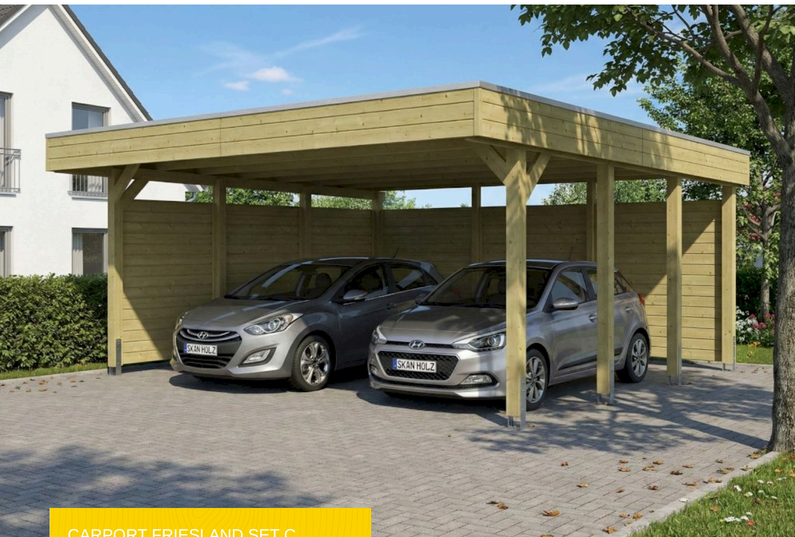
CARPORT FRIESLAND SET C 546 x 555 cm