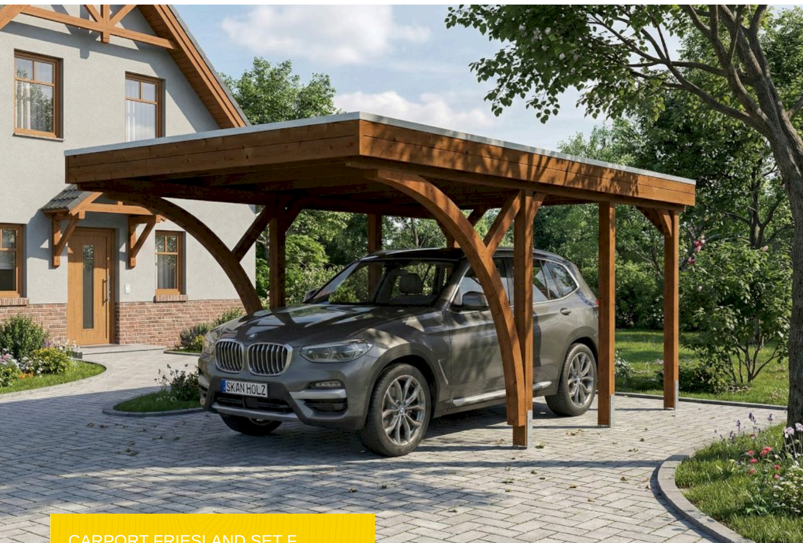
CARPORT FRIESLAND SET F 320 x 555 cm