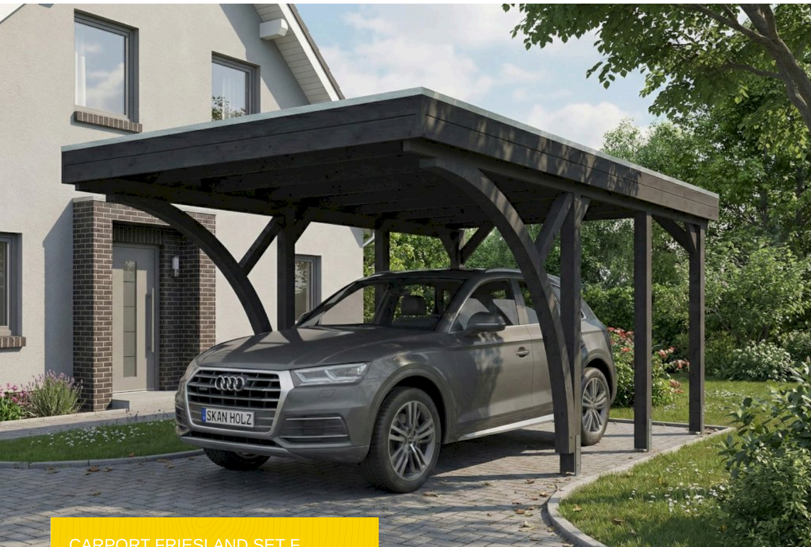
CARPORT FRIESLAND SET F 320 x 555 cm