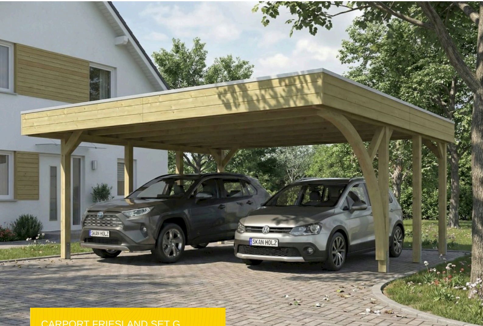
CARPORT FRIESLAND SET G 546 x 555 cm