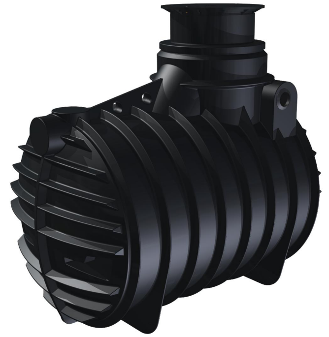
Ausgleichsdom 1:15 dôme coulissant

GreenLife * optionales Zubehör erforderlich Technische Weiterentwicklungen und Änderungen der einzelnen Artikel, sowie Irrtümer, Druckfehler und Preisänderungen vorbehalten. Fotos und Zeichnungen sind unverbindlich. Technologisch bedingt können geringfügige Maß-, Gewichts- und Farbabweichungen auftreten. Die Lieferbedingungen erfragen Sie bitte bei Ihrem Händler vor Ort. * accessoire en option requis Sous réserve d'adaptions et de modifications techniques des articles ainsi que d'erreurs, fautes d'impression et modification des prix. Photos et représentations sans engagement. Pour des raisons techniques, des différences légères dans les dimensions, poids et couleurs peuvent survenir. Consultez votre distributeur local pour les conditions de livraison.