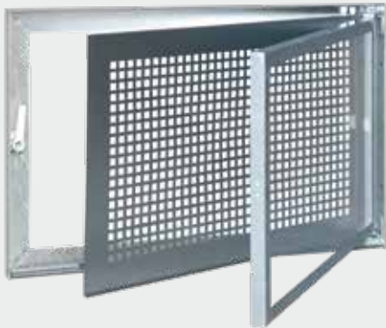
Type SD1 = un vantail