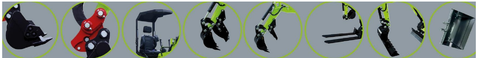
(1) : Sshaufal (2) Très cellulaire (B) : Böachung (3) : Sonnendash (4) : Couvercle (5) : Pouce (6) : Palemzt (7j) : Recfsen