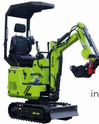
Drehpunkt fürs Sonnendach