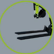
(6): Paletten gabel