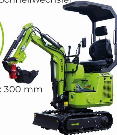
(3): Sonnendach einklappbar