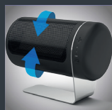
regulierbare bis 50°